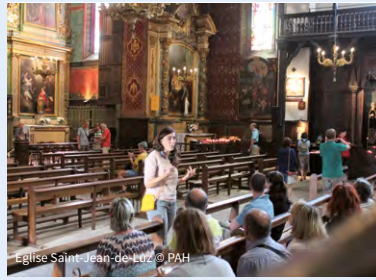
Eglise Saint-Jean-de-Luz