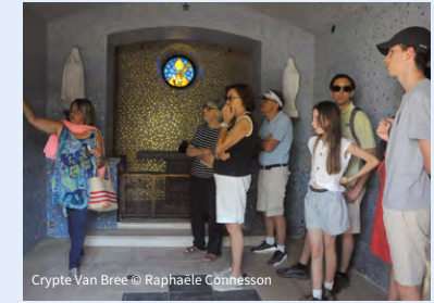
Crypte Van Bree