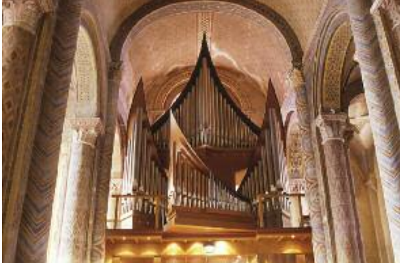
Le grand orgue - XX e siècle The Great Organ, 20th century