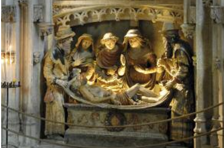
Mise au tombeau - Chapelle Sainte-Anne, dite du Fou Entombment - Sainte-Anne chapel (Chapelle du Fou)