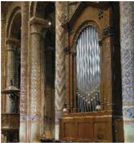
Petit orgue de chœur - XIX e siècle Small choir organ, 19th century