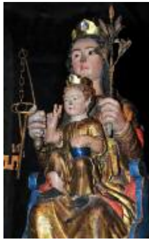
Notre-Dame-des-Clefs - XVII e siècle Our Lady of the Keys, 17th century

Dans le chœur se trouve une statue de la Vierge à l'Enfant, appelée Notre-Dame-des-Clefs. Selon une légende médiévale, la Vierge serait intervenue afin d'éviter que la ville ne soit livrée aux Anglais par un traître qui voulait leur en donner la clef. Disparu, le précieux objet fut retrouvé miraculeusement dans la main de la statue. C'était l'origine d'une grande procession ayant lieu tous les lundis de Pâques, jusqu'au XIX e siècle. La statue actuelle, basée sur un modèle de l'époque romane, est une création du XVII e siècle.