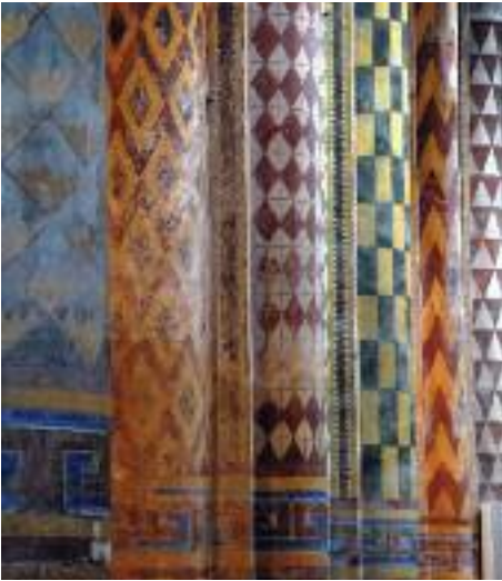
Peintures intérieures - XIX e siècle Interior murals - 19th century