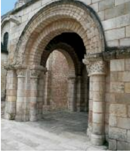
Porche roman Romanesque porch

Le clocher est couronné d'un toit en écailles. C'est une forme de couverture fréquente dans le Grand Ouest. Il se retrouve par exemple à Saintes ou à Angoulême. Le mur sud conserve son porche roman, bien que très restauré au XIX e siècle. Il était surmonté à l'époque romane d'un cavalier sculpté, haut-relief refait au XVII e siècle puis détruit après la Révolution. Un petit porche gothique a été rajouté au XV e siècle. Les bâtiments des chanoines étaient situés du côté nord de la nef. Le cloître, datant des XII e et XIII e siècles, est totalement démoli en 1859. Les sculptures de ce cloître sont visibles dans la cour de la faculté de droit (en face de l'église) et au musée Sainte-Croix. La porte murée du cloître est toujours visible dans l'église.