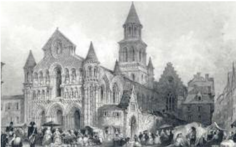
Notre-Dame-la-Grande, dessin de Thomas Allom, vers 1830

Tout au long des XV e et XVI e siècles, différentes chapelles privées appartenant aux familles de la haute bourgeoisie poitevine sont aménagées du côté nord de l'église. En 1562, le bâtiment subit les destructions des Huguenots qui pillent l'édifice, brûlent les reliques et décapitent la plupart des statues de la façade par iconoclasme*.