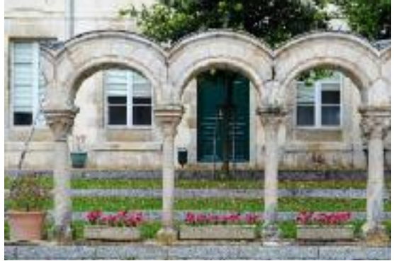
Vestige du cloître de l'église, cour de la faculté de Droit Sculptures from the cloister, courtyard of the Law school