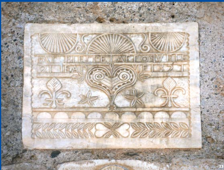
13. Pierre encadrée aux motifs de fleurs de lis et de coeurs, anonyme, Louvie-Soubiron

« Quelques grands noms de la sculpture classique française ont travaillé ce matériau et produit des œuvres majeures »