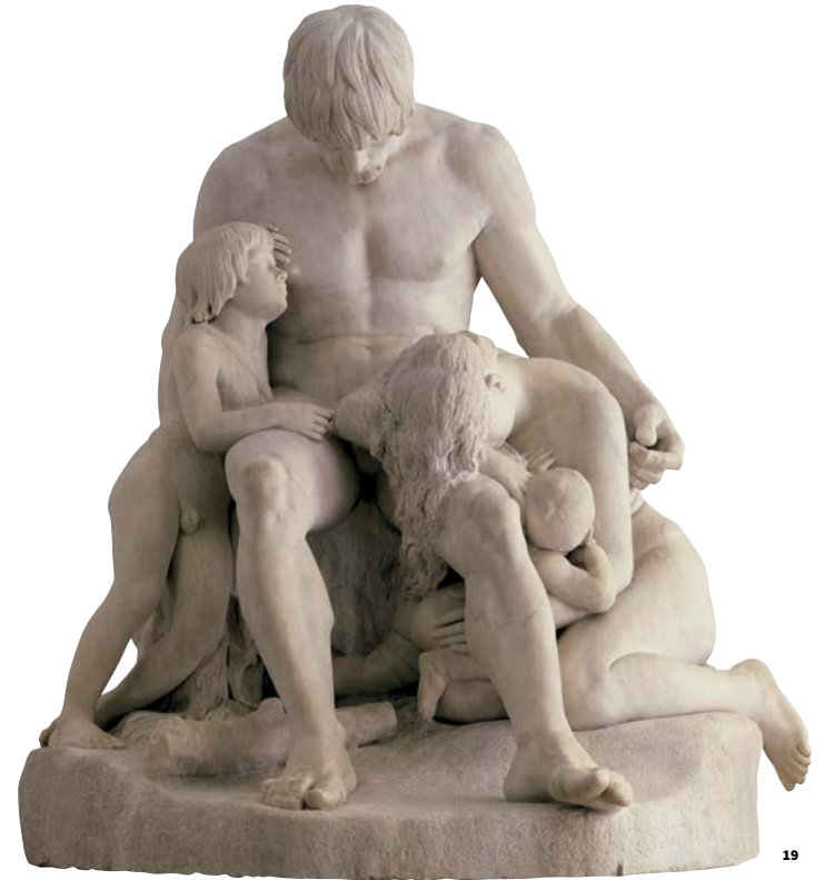
19. Cain et sa race maudite des Dieux par Antoine Etex