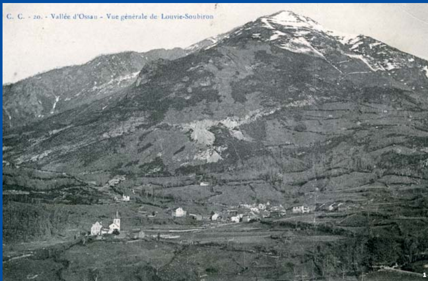
1. Louvie-Soubiron et ses carrières, avant 1921

« De toutes les mines qui ont été découvertes dans les montagnes, celle qui est dans le territoire de Louvie-Soubiron se trouve la plus propice, le marbre y étant de meilleure qualité. »