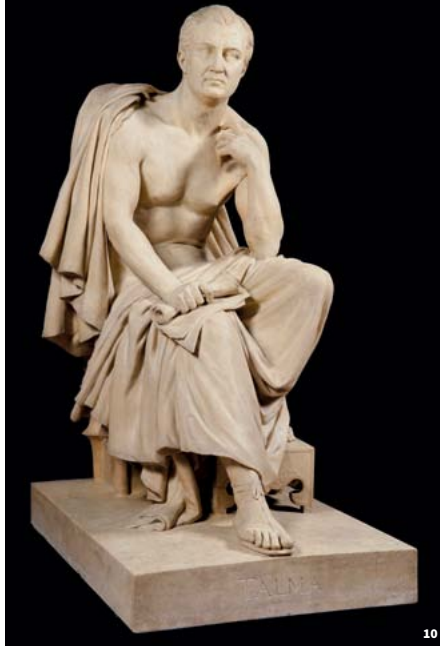
10. Talma méditant le rôle de Sylla par David d'Angers